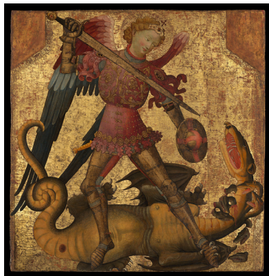
Svatý Michael a drak (neznámý španělský malíř, počátek 15. století)