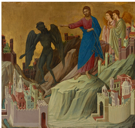
Kristus přemáhá pokušitele (Duccio di Buoninsegna, cca 1310)

Následovat Krista neznamená prostě opakovat jeho někdejší kroky. Zlo nás svádí s cesty stále stejným způsobem, ale každého z nás v jiný čas a za jiných okolností. A síla Kristova zmrtvýchvstání nám dává odvahu a moudrost, abychom zlu odpovídali způsobem novým a tvůrčím.